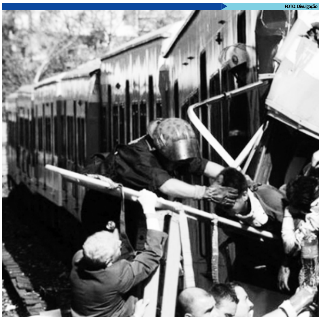
Equipe de resgate remove homem ferido após acidente com trem na estação de Once, em Buenos Aires