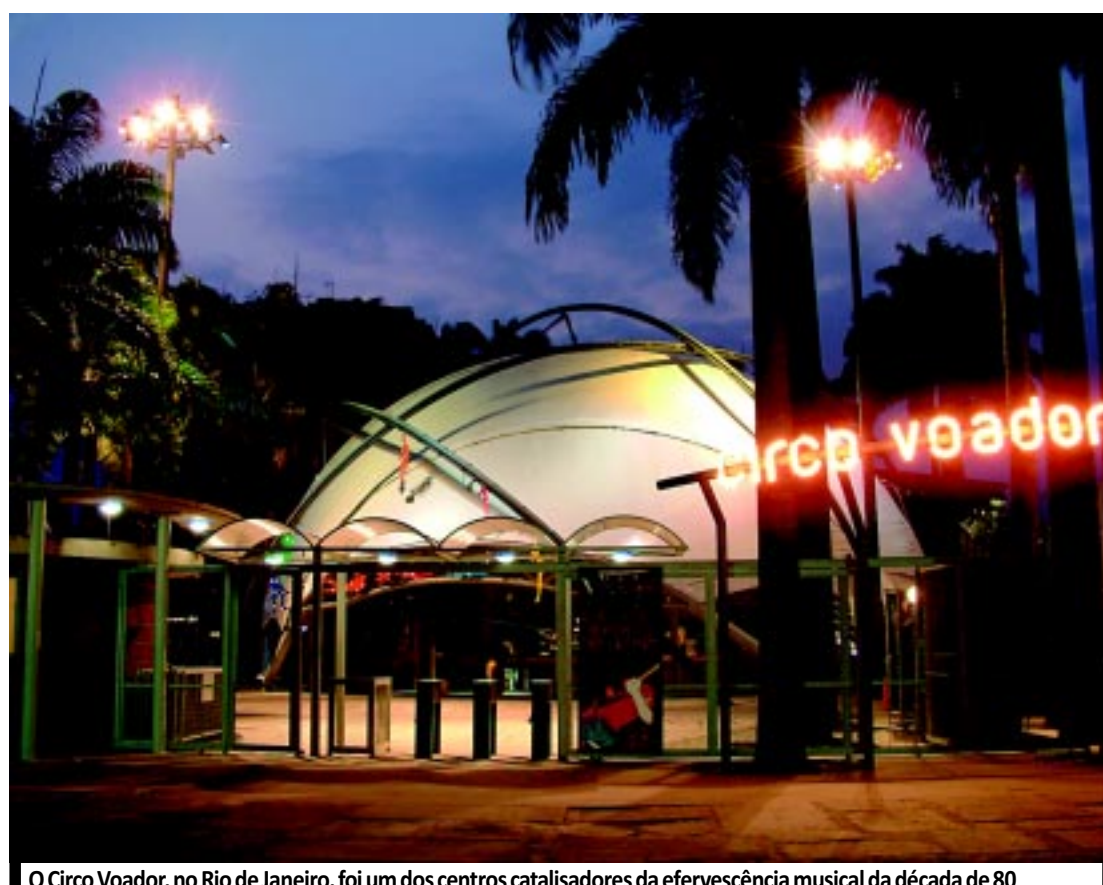
O Circo Voador, no Rio de Janeiro, foi um dos centros catalisadores da efervescência musical da década de 80

Foi preciso ali dar um chute na porta, nas palavras de quem viveu os primeiros anos da década de 80 sob a lona do Circo Voador. E pior, a porta estava fechada com cadeado. A música brasileira não estava para piadas, com artistas ainda tateando no escuro de uma ditadura traumática. O presidente João Baptista Figueiredo vinha em um processo de abertura mais lenta do que gradual e a inflação batia nos 200% ao mês. As rádios e TVs não tinham clima para festa. Os artistas ouviam a Blitz e torciam o nariz. Quando o segundo disco chegou, em 1983, com o nome de Radiatividade e dois cavalos de batalha, a balada 'A Dois Passos do Paraíso' e a quase censurada 'Betty Frígida', não deu para segurar. A nova juventude estava criada. E o rock virou pop.