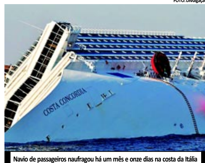
Navio de passageiros naufragou há um mês e onze dias na costa da Itália