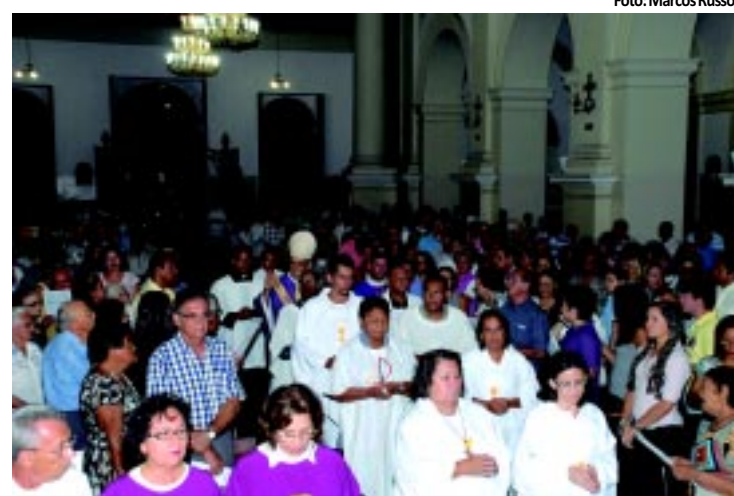
A Missa foi celebrada em JP pelo arcebispo Dom Aldo

A Delegacia de Homicídios de Campina Grande concluiu o inquérito sobre o estupro de cinco mulheres e o assassinato de duas delas, ocorrido em Queimadas. Sete acusados foram indiciados e três adolescentes responsabilizados por formação de quadrilha, estupro, homicídio e porte ilegal de arma. PÁGINA 8