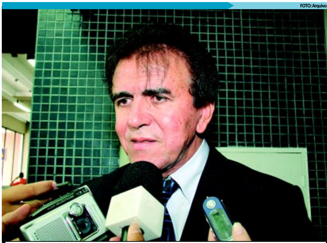
Presidente da Famup explica que será um momento importante para os prefeitos pressionarem os parlamentares