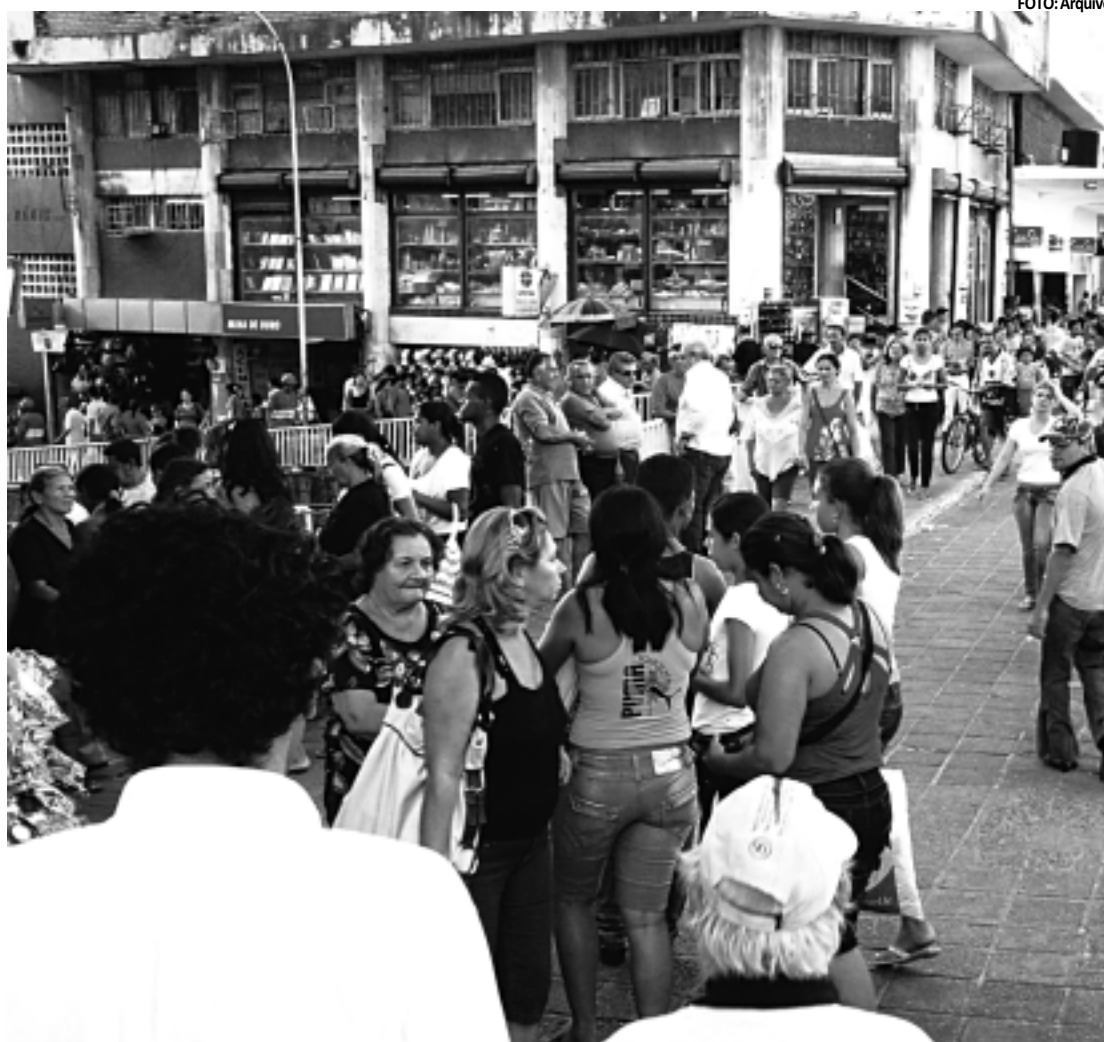
Horário de verão acaba no dia 26 e as pessoas terão que preparar o organismo a mudança, orienta neurologista

BALANÇA COMERCIAL - Apesar de as exportações terem reagido em fevereiro, depois de déficits consecutivos nas quatro semanas de janeiro, o superávit da balança comercial no acumulado do ano é 78% menor em relação a 2011. Segundo números divulgados ontem pelo Ministério da Indústria, Desenvolvimento e Comércio Exterior (MDIC), o país exportou US$ 429 milhões a mais do que importou do início do ano.