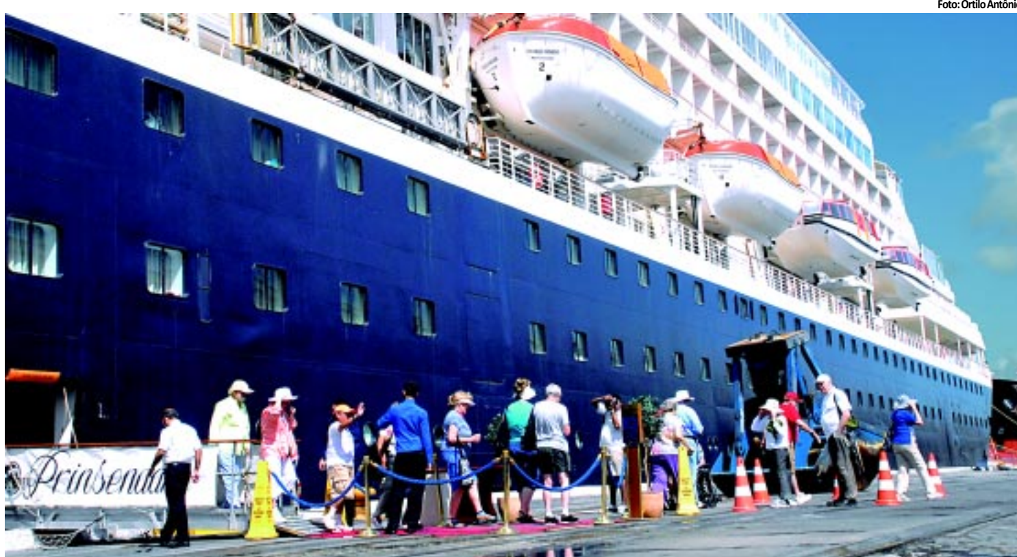
TURISMO | 835 passageiros do navio Prinsendam desembarcam em Cabedelo PÁGINA 12

✓ Atendimentos de trauma e emergência caíram 15%