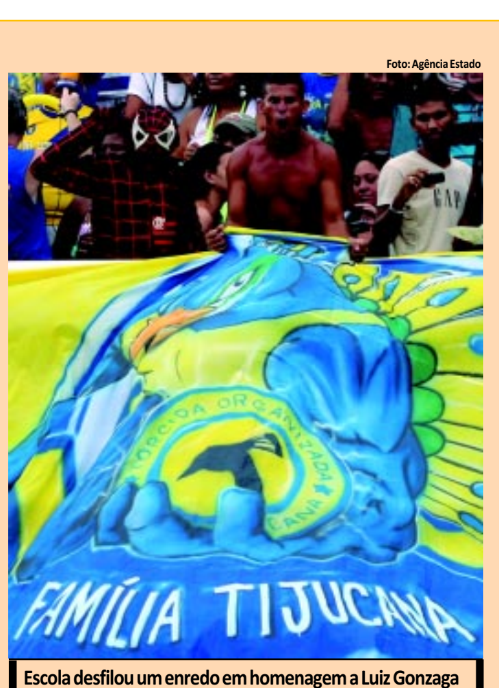
Escola desfilou um enredo em homenagem a Luiz Gonzaga

A Unidos da Tijuca foi eleita a campeã do Carnaval do Rio de Janeiro de 2012. A agremiação desfilou o enredo "O dia em que toda a realeza desembarcou na avenida para coroar o rei Luiz do Sertão", em homenagem ao Rei do Baião, Luiz Gonzaga. Este é o terceiro título da escola, que também ganhou em 1936 e em 2010. Em segundo lugar ficou o Salgueiro, seguida por Vila Isabel, Beija-Flor, Grande Rio e Portela. PÁGINA 22