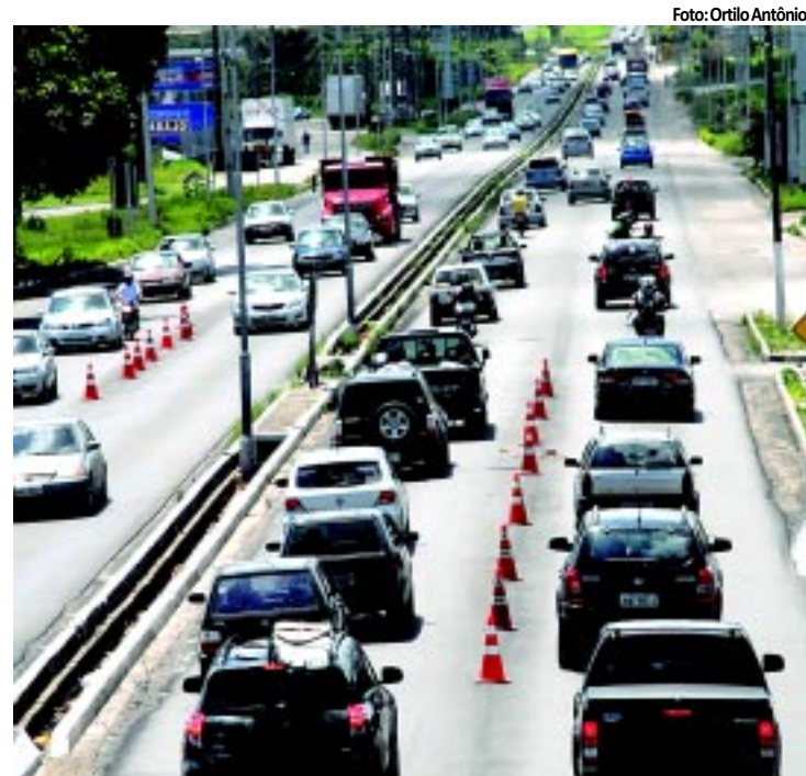
Foram registrados 78 acidentes nas rodovias federais

FÚRIA Família é atacada por pitbull em Camboinha 2 Uma família foi atacada e um cão de estimação foi morto por um cachorro da raça pitbull em Camboinha 2, no município de Cabedelo. Para se proteger do cachorro, as vítimas pularam na piscina. PÁGINA 10